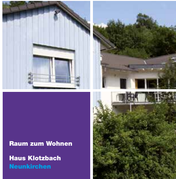
Raum zum Wohnen Haus Klotzbach Neunkirchen

Großen Wert legen wir auf die regelmäßige Auswertung der jeweiligen Betreuung, damit das Hilfsangebot den veränderten Bedürfnissen der Bewohner/-innen angepasst werden kann. Gleichzeitig garantieren wir so eine permanente Verbesserung unserer Betreuungs- und Pflegeleistungen.