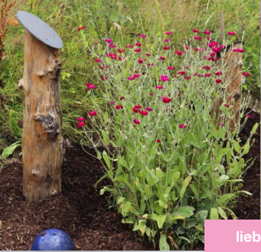
liebevoll gestaltete Außenflächen