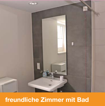
freundliche Zimmer mit Bad