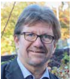
Jürgen Schneider Beratung Hausnotruf

Ein Kontakt erfolgt über die Diakonie-Stationen.