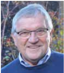
Werner Weller Beratung Hausnotruf

Ein Kontakt erfolgt über die Diakonie-Stationen.